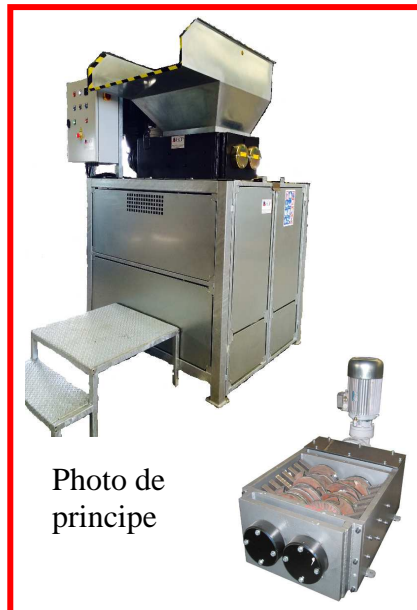
Photo de principe