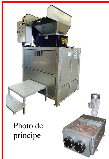
Photo de principe